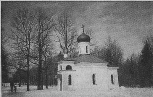
Часовня на месте убийства.