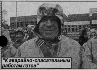
«К аварийно-спасательным работам готов»