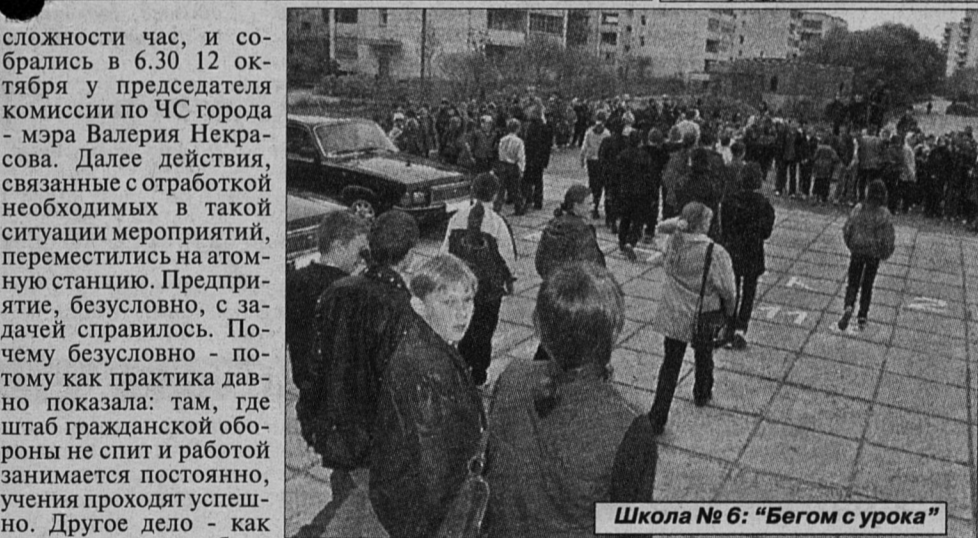
Школа № 6: «Бегом с урока»