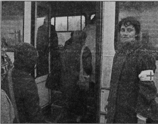
Теоретическое занятие по эвакуации населения проводит ПО ЖКХ на базе ЖЭКа-4