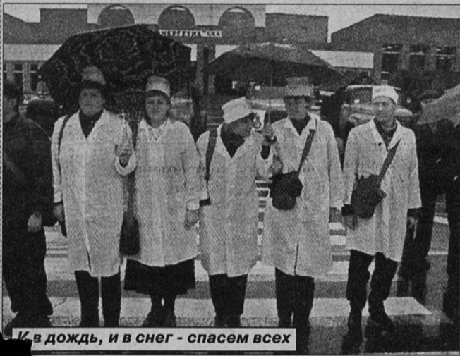
И в дождь, и в снег - спасем всех