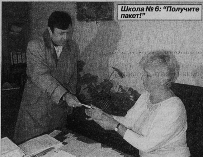
Школа № 6: «Получите пакет!»