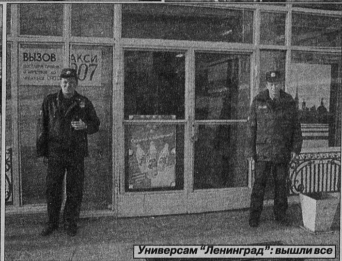
Универсам «Ленинград»: вышли все