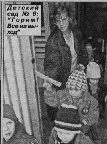
Детский сад № 6: «Горим! Все на выход»