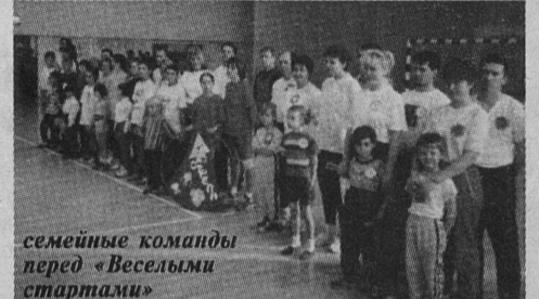
семейные команды перед «Веселыми стартами»