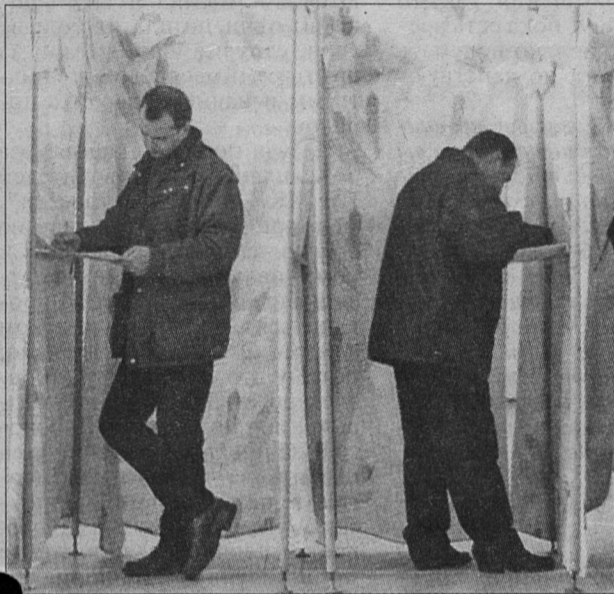
Протокол избирательной комиссии №1