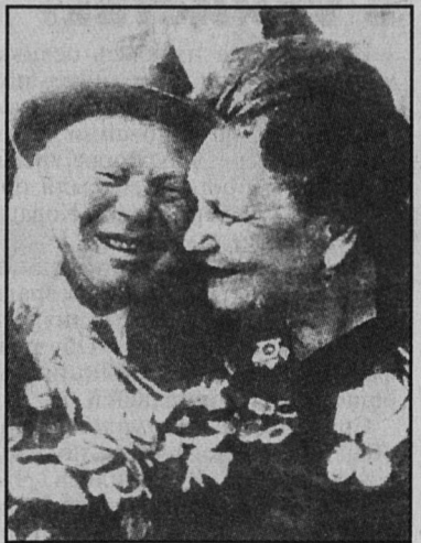
стендов - впечатления незабываемые.

... Одна великая актриса, вспоминая о годах своей юности, призналась, что "присутств" первой любви она перенесла, взяв в руки