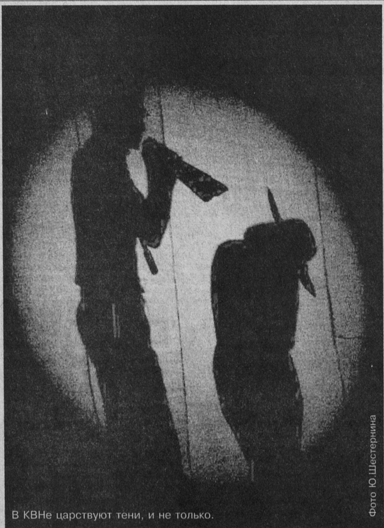
В КВНе царствуют тени, и не только.