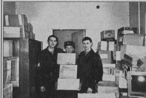
От этого доброго груза ребятам, воюющим в Чечне, на душе должно стать теплее.