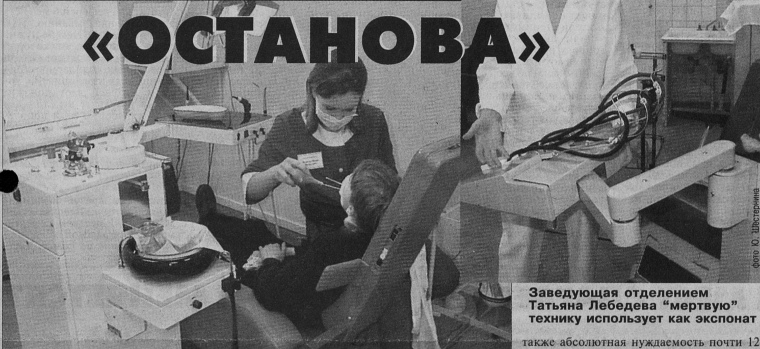
Единственная действующая установка - и та едва жива

Причина сложившейся ситуации - в полном износе двух из трех имеющихся на отделении стоматологических установок. Они давно выработали свой ресурс и теперь не хотят работать даже при регулярном общении с мастерами из "Медтехники".