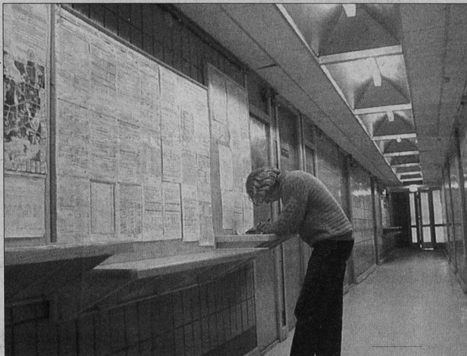
Декларации о доходах в налоговой инспекции сдают пока единицы.

тельную консультацию налогового инспектора, что-то сразу же поправить в своих расчетах. В последние дни апреля, когда традиционно с декларациями в инспекции устремится более половины тех, кто обязан их подавать, речь будет идти только о сдаче документов - помочь налогоплательщику в ситуации, когда за его спиной стоит огромная очередь, просто физически невозможно. Представьте себе, в целом по России в последнюю неделю декларационной кампании подается до половины деклараций. Так что не портите себе предпраздничное майское настроение, представьте декларацию о доходах за 1999 год в ближайшие дни.