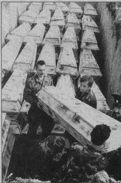
Завершение скорбной работы.

В Ленинградской области только в 1999 году побывали поисковые отряды из 16 регионов России. Но особенно тесные контакты у сосновоборских поисковиков сложились с клубом "Космос" из Военной Инженерно-Космической Академии имени А.Ф. Можайского.