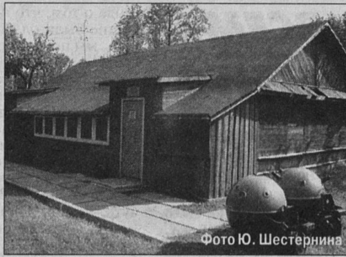
этого необходимо главное - желание самих ребят.

Есть у музея и планы на будущее: он будет расти как в прямом, так и в переносном смысле. С огромным удовольствием Н. Акифьева взялась бы за работу с подростками и хотела бы организовать кружок при музее, но для