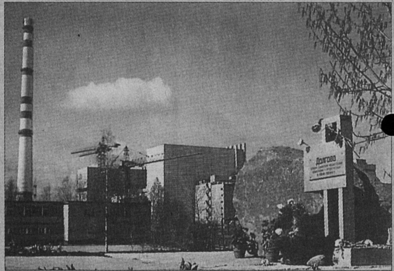
Памятник на месте бывшей деревни Долгово, разрушенной во время Великой Отечественной войны.

Во вторник, 23 января, губернатор Ленинградской области Валерий Сердюков провел совещание по вопросам обеспечения региона электроэнергией в зимний период и усиления контроля по сбору платежей.