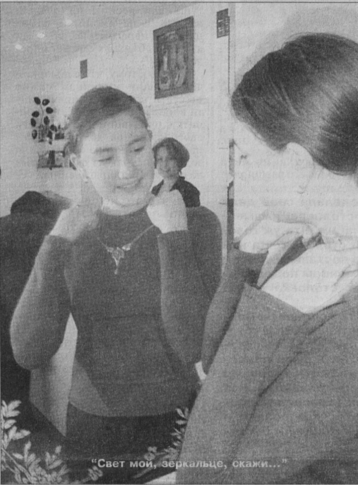
"Свет мой, зеркальце, скажи..."