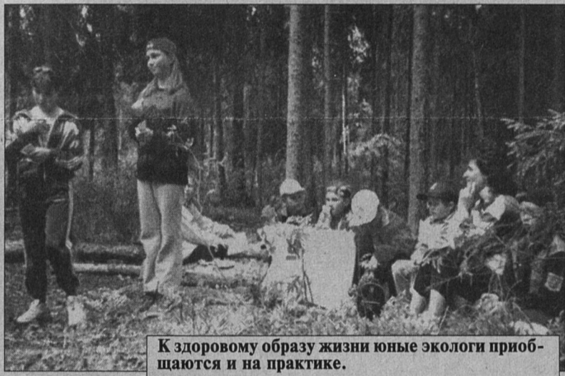
К здоровому образу жизни юные экологи приобщаются и на практике.