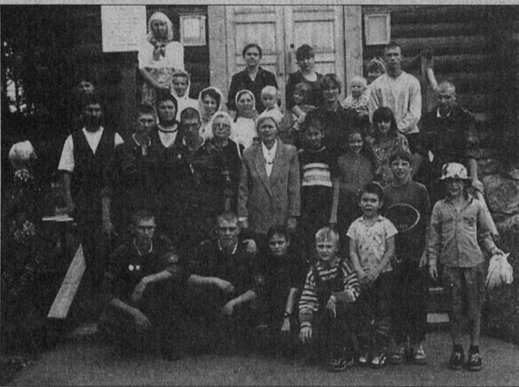
Воины-пограничники среди паломников

ность участвовать во всех совместных мероприятиях, и потому могут сами познакомиться с условиями быта солдат и их воинской службы.