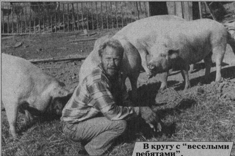
В кругу с "веселыми ребятами".

поросята: одни, глядя на маманю-свинку, учатся управлять с подножным кормом, другие пашут пятаками землю, что-то находят, смачно жуют. Иногда, как по команде, отвлекаются от дел и затевают игру в догонялки. Такое впечатление, что живут они здесь весело и дружно, как ребята в пионерском лагере.