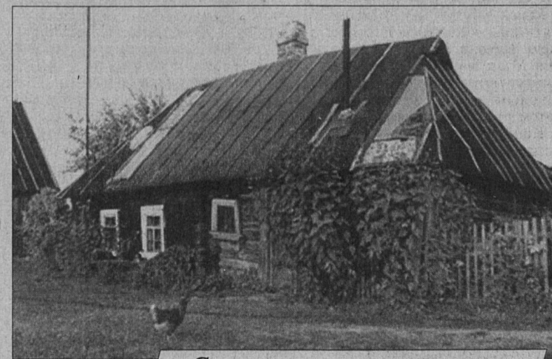
С этого дома все начиналось.