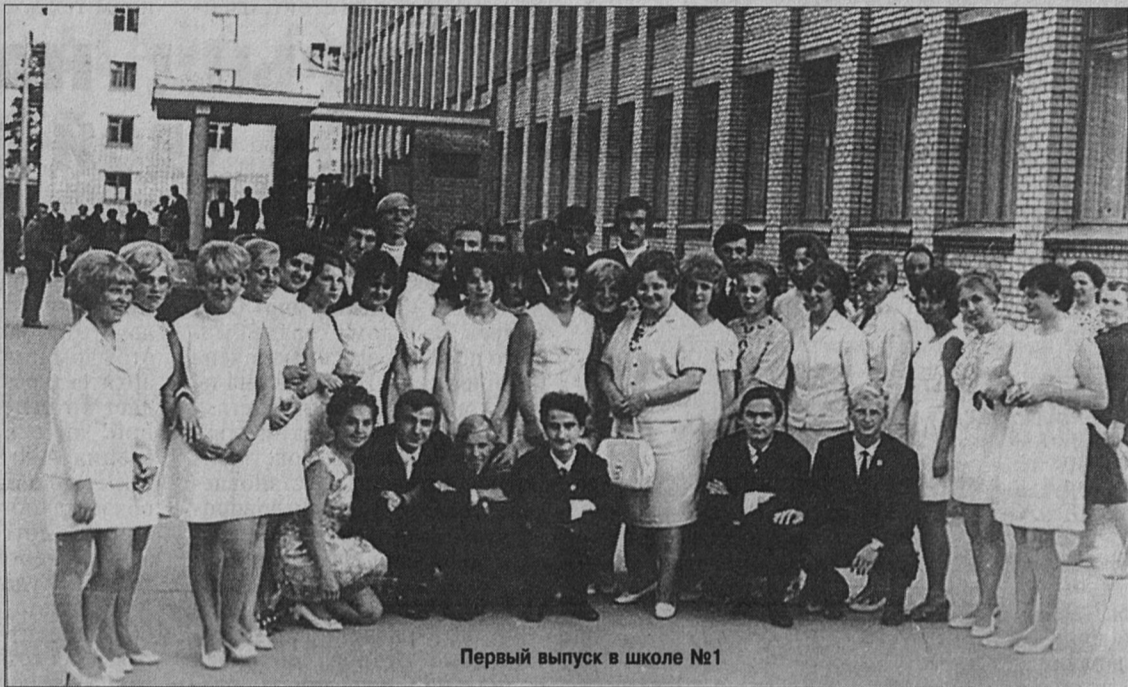
Первый выпуск в школе №1