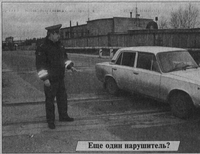
Еще один нарушитель?