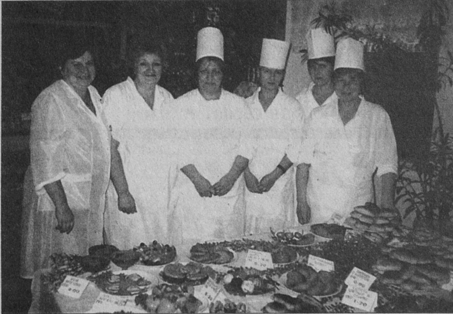
“Приятного аппетита!” - желает коллектив столовой школы №3

Ведь каждый раз повара преподносят нам вкусные сюрпризы - блюда всегда новые, и школы никогда не копируют друг друга. Повторений кухни - нет! Можно сказать, что у нас “царит” здоровая конкуренция.