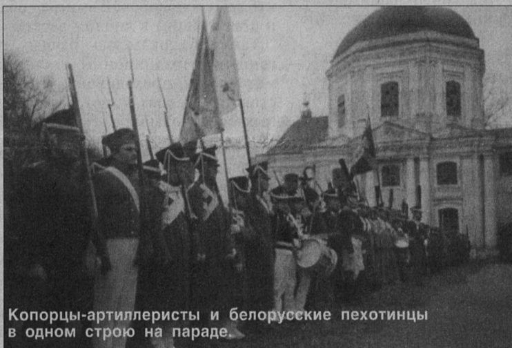
Копорцы-артиллеристы и белорусские пехотинцы в одном строю на параде.

А вот Вязьму и Сосновый Бор как малые города России сравнить можно и нужно. Сначала - несколько данных, почерпнутых в энциклопедии "Города России": "Вязьма - районный центр областного подчинения, находится в Смоленс-