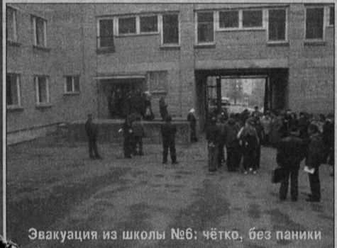
Эвакуация из школы №6: четко, без паники

Задействованы были или, точнее, предполагались быть задействованными практически все городские службы, предприятия и организации. Увы, наша местная практика показала, что не все