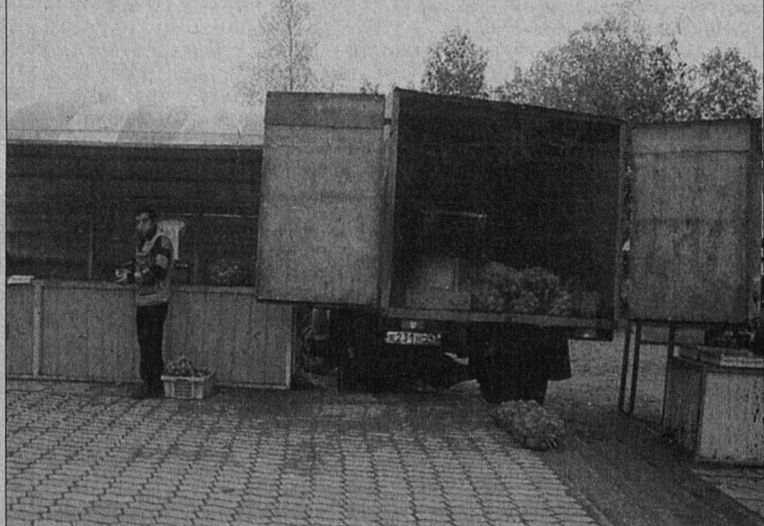
С виду - всё чисто?