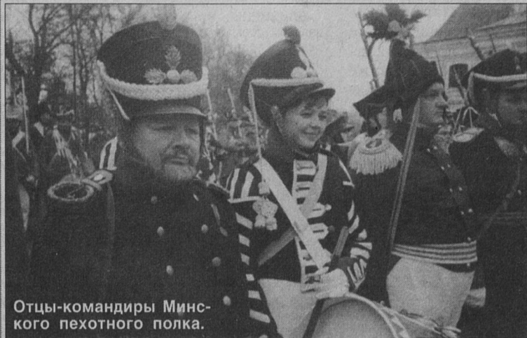
Отцы-командиры Минского пехотного полка.

Дул пронизывающий холодный ветер. Пехотинцы, артиллеристы и конники, ожидая начала сражения, старались укрыться от его внезапных порывов. Ноги вязли в грязи. Старая гвардия ободряла новобранцев, среди которых на сей раз было особенно много ополченцев. Все ждали начала сражения. Сражения под Вязьмой.