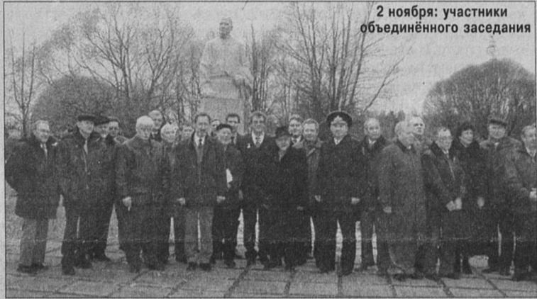
2 ноября: участники объединённого заседания