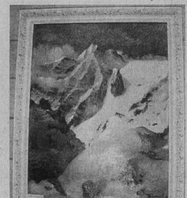
“В горах” - Ю. Резников