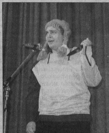
У команды «Финт» лица №8 - свои финты

Конечно, есть ещё над чем поработать и актёрскому составу игроков, и тем, кто занимается мозговым штурмом кавээнновской крепости. С весельем, пожалуй, проблем особых нет. Зато с находчивостью - напряжённо, о чём особенно свидетельствует опыт чуть ли не всех