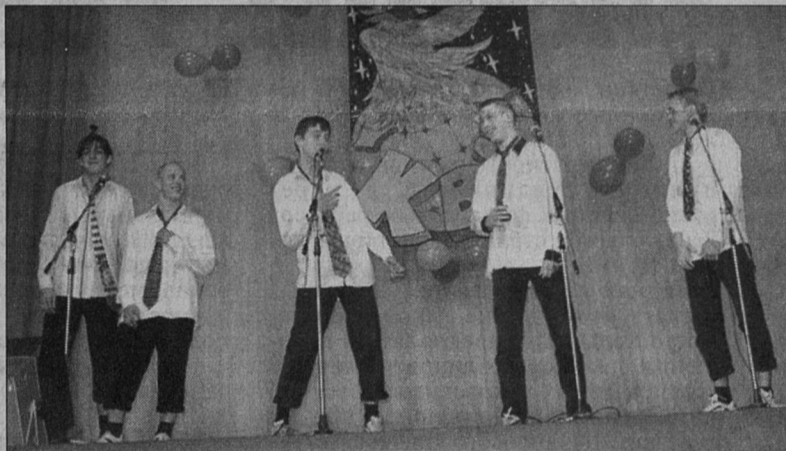
Политехнический институт: неплохое начало

Мы уже сообщали о выставке произведений педагогов детских художественных школ области и предложении комитета по культуре правительства: а не устроить ли персональную выс-