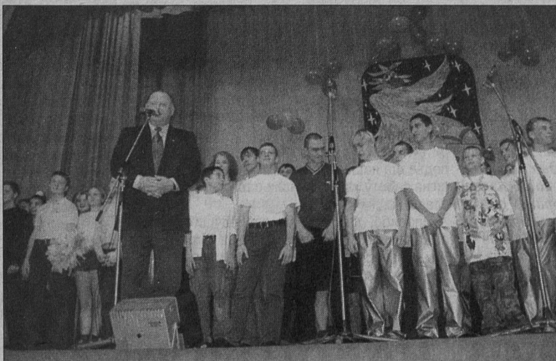
Чемпионат на кубок мэра открывает, как всегда, мэр

И это объяснимо. За команды идут поболеть представители не только школ города, но и профессиональных лицеев, местных филиалов ВУЗов - то есть всех тех, кто выходит на сцену. Число команд-участников всегда держится около отметки «13». Новый сезон 2001-2002 собрал именно такое количество участников. С другой стороны, уровень игр с каждым разом всё выше, и это весёлое и приятное мероприятие, изначально не ставшее междусобойчиком, преврати-