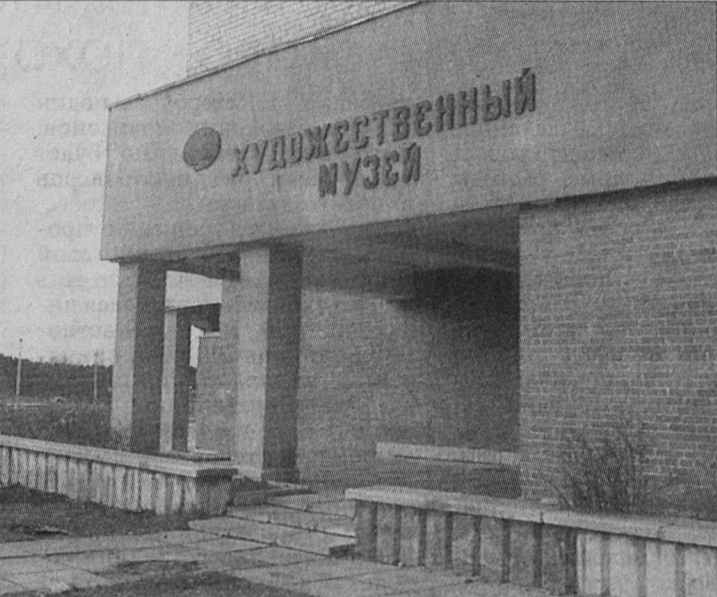
фонда, это - лишь часть накопленного уже самостоятельно.