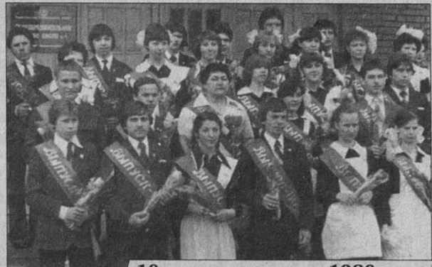
10-а класс, выпуск 1980 года

Получают воспитанники школы №4 призы на городских предметных олимпиадах. Много лет сует разумное, доброе, вечное учителя-