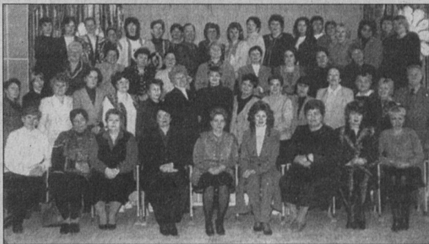
Сегодня в школе № 4 - 68 учителей

Пусть вашу жизнь согревает теплый свет негаснущих окон вашего второго дома!