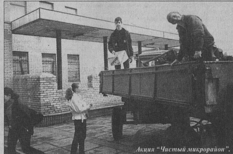
Акция «Чистый микрорайон».

А третье направление, по которому мы идем, - внеклассная работа и