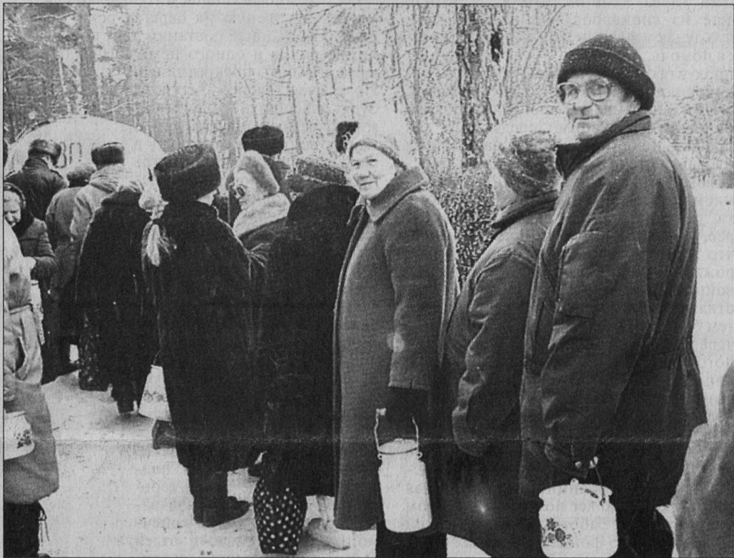
Желающих оказать кредит доберия - целая очередь. Всемирный день потребителей. Было это 15 марта 1983 года. В 1985 году Генеральная ассамблея ООН приняла резолюцию "Руководящие принципы для защиты интересов потребителей", которую подписало и правительство СССР. С этого времени в нашей стране начался сложный процесс создания собственного потребительского законодательства.

А через двадцать лет после исторической речи американского президента, в которой он сказал, что "потребители, по определению - это все мы", впервые отмечался