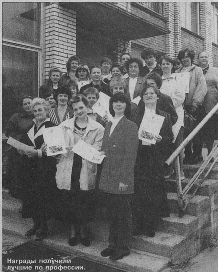
Награды получили лучшие по профессии.

- Мне представляется, что и сами горожане могут в известной мере способствовать сокращению коммунальных расходов, затрат на благоустройство. Мы забыли