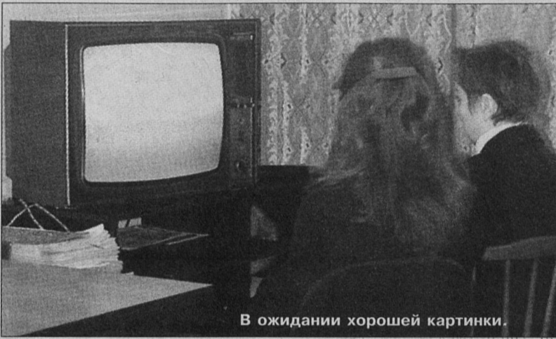
В ожидании хорошей картинки.