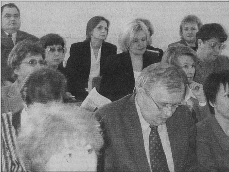
Из пресс-службы губернатора Ленобласти