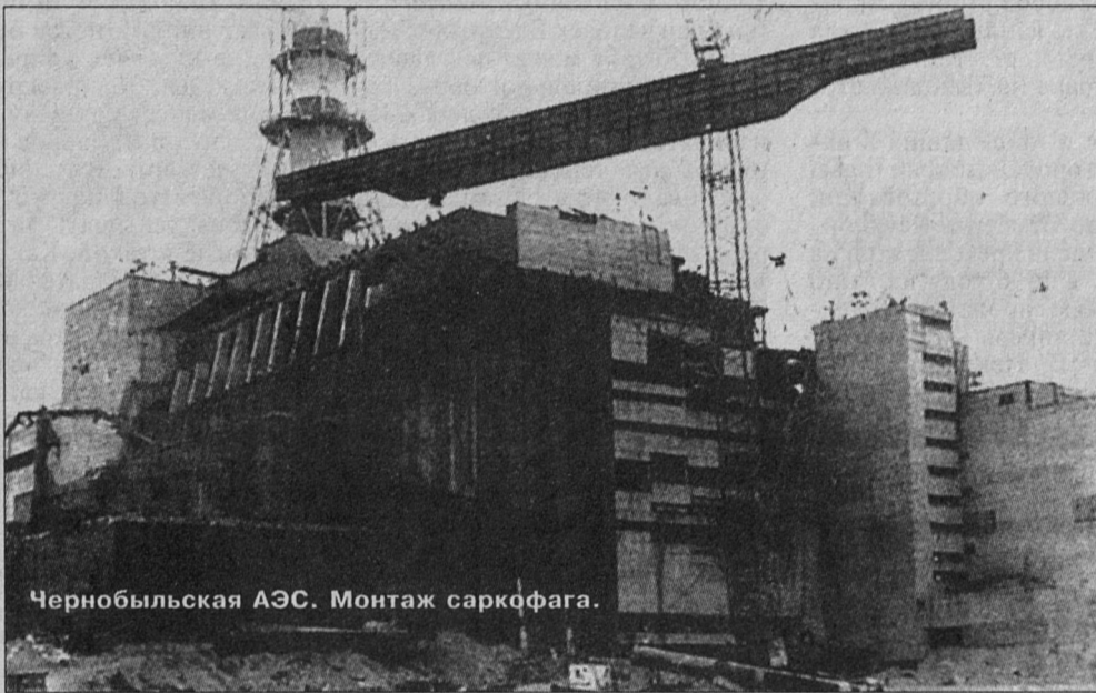
Чернобыльская АЭС. Монтаж саркофага.

В канун 15-й годовщины аварии на Чернобыльской АЭС сосновоборской городской ассоциацией общественных объединений «Союзчернобыль - Сосновый Бор» получено письмо председателя Государственной Думы Г. Селезнёва.