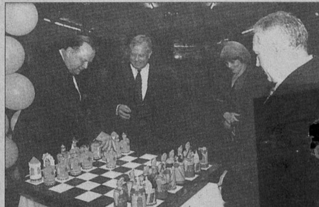
Первый ход. Второй - Ленинградской АЭС, администрация которой преподнесла такой вот шахматный подарок.