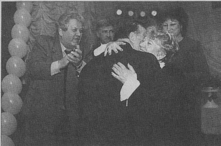
Крепки объятия коллектива ОАО «УПП».