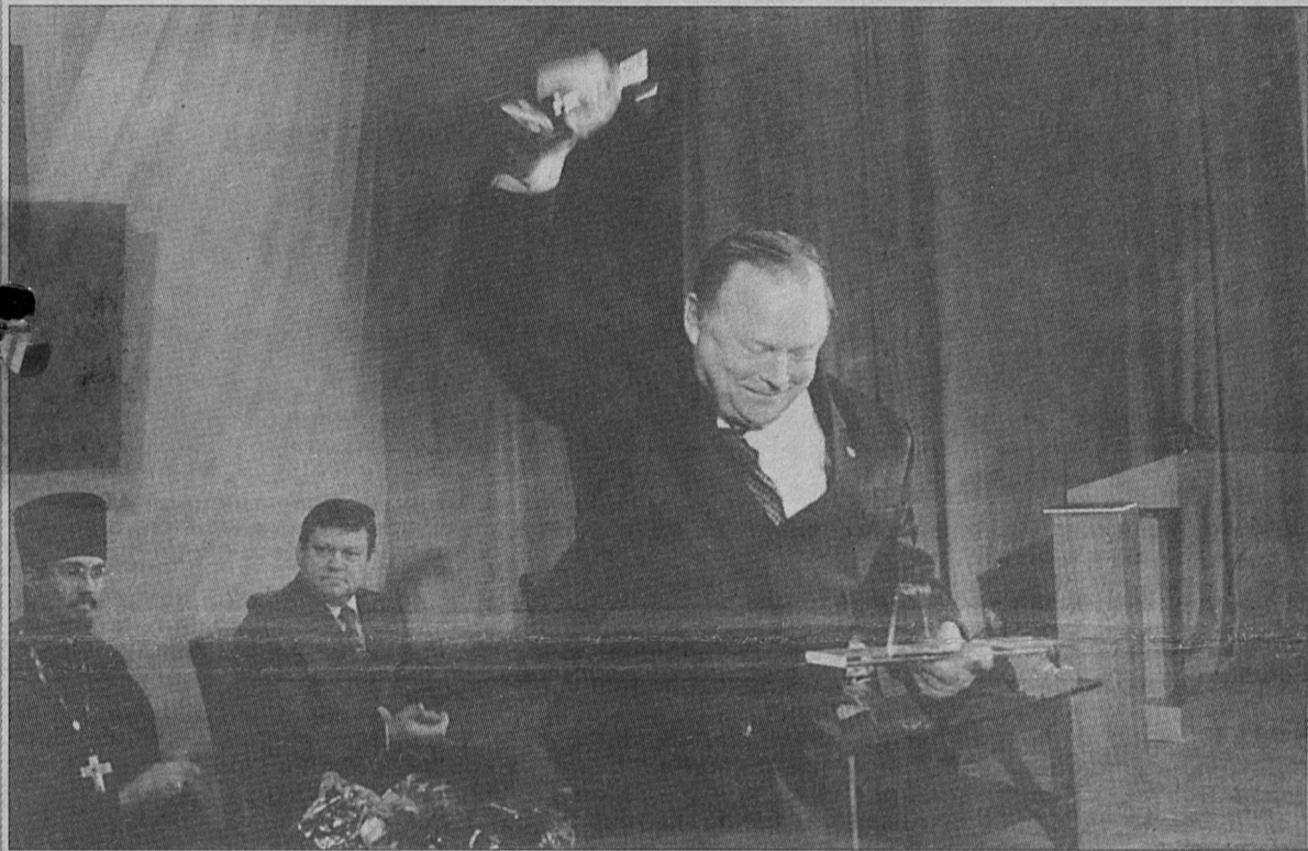
Символический ключ от города - в руках вступившего в должность мэра.