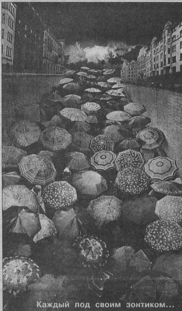
Каждый под своим зонтиком...

Нет сомнения, что депутаты, принимая это решение, хотели сделать как лучше, а получилось даже не как всегда, а гораздо хуже. И какую область нашей сегодняшней жизни не взять, нам далеко до показателей, которые имела РСФСР в 1990-м году. За эти 11 лет мы рухнули в яму, из которой, судя по всему, выкарабкиваться будем ещё очень долго. И частные плюсы (а они, конечно, есть) бессильны изменить оценку общей ситуации. И вновь звучит вопрос «Кому на Руси жить хорошо?». Ибо одним суверенитетом, сколько его не проглотить, сыт не будешь. И об этом в