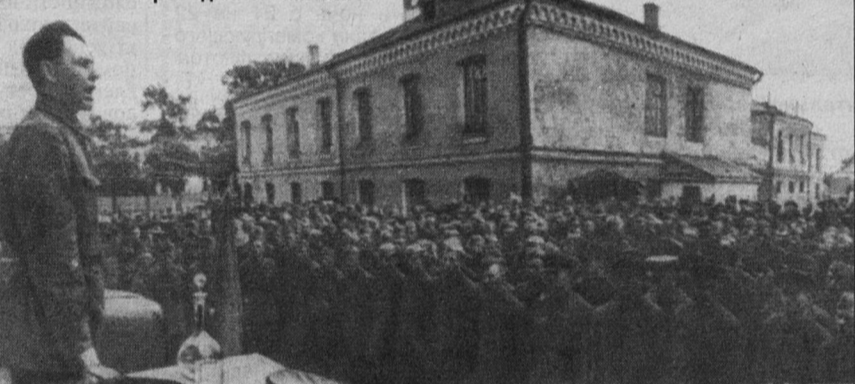
В воинских частях и на предприятиях 22 июня проводились митинги.

Прошло шесть десятилетий с того рокового дня, когда началась Великая Отечественная война. Война народная, священная. Она была навязана нам фашистской Германией, с которой в августе 1939 года был подписан договор о ненападении.