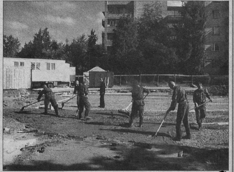
Место для нового павильона (его эскиз см. ниже) уже есть, работа кипит. Осталось определиться со временем...