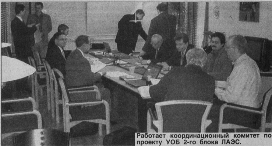
Работает координационный комитет по проекту УОБ 2-го блока ЛАЭС.