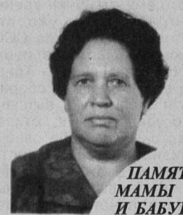
ПАМЯТИ МАМЫ И БАБУШКИ