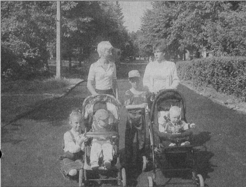
По Высотной приятно проехать на автомашине... и погулять с детьми

Недавно в СМУП "ПО ЖКХ" состоялось совещание, на котором руководители подразделений предприятия подвели предварительные итоги подготов-